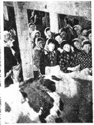
33年夏、県種畜場で開かれた婦人酪農講習会

三倍以上えた乳牛とサイロ 乳牛とサイロの生産量は、三倍以上増えた。これは、県民の協力のおかげである。また、県民所得の向上も、計画通り進んでいる。