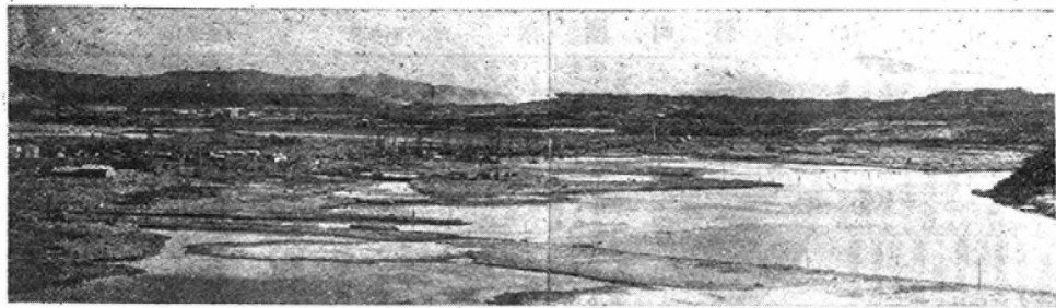
— 昨年12月から土地造成事業を開始した秋田臨海工業地帯 —

新生活運動 お正月は、家族そろって 簡素で、明るく みんなで話し合つて くらしの設計を はつたりたてましょう