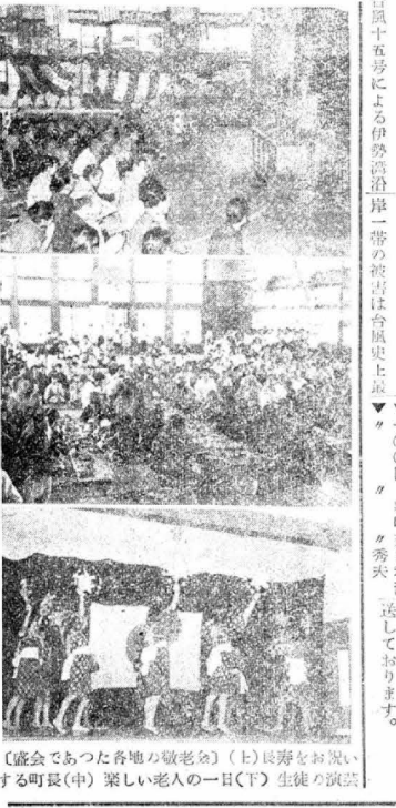
〔盛會であつた各地の敬老会〕(上)長寿をお祝いする町長(中)楽しい老人の一日(下)生徒の演説