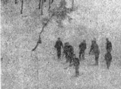
(写真は五連青の青年祭)

馬川青年会では去る二月十四日に馬川小学校を会場にして開かれ、弁論大会、土曜調査の経過報告、式典と言つた具合で、その結果は次の通りであつた。