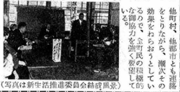
(写真は新生活推進委員会結成風景)

な家庭生活、ひいては社会生活の営まれること、をねらひたい。具体的な運営方針、施策及び奨励事項については、近く「常任委員会」に於いて立案計画されることとなつてゐる。