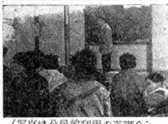
(写真は公民館利用の若妻会)

の「事務報告」のために調査した資料によると、昨年の五月十七日、二十三日、その間に一九五〇年その内訳は、一、婦人団体二二〇、二、青年団体八四〇、三、その他社団三二二