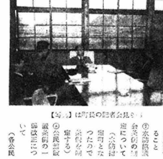
【写】は町長の記者会見

町民の待望する重要路線の整備に努めている。本年度は、五〇二米の予算を以て、重要路線の整備に努めている。