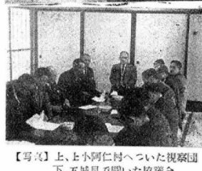
【写真】上、上小阿仁村へ行った視察団下、五城目で開いた協議会