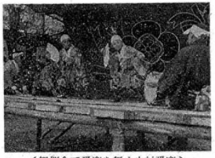
(観覧会で番楽を舞う中村番楽)

日赤社員増強運動に 日赤は赤十字の理想とする人道の任務を遂げるため、日夜努力を重ねておりますが、尚一層社会の要を反映した活動を強め、より充実し、より高め、