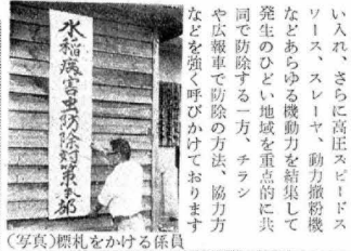
(写真)標札をかける係員