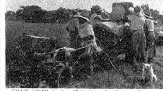
(写真)高圧スピードスローヤ