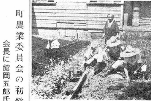
【写真】花壇の手入れに余念のないとしよりたち

町議会 六月定期町議会は七月二十三日から開かれ八月二日に十一日の会期を閉じました。