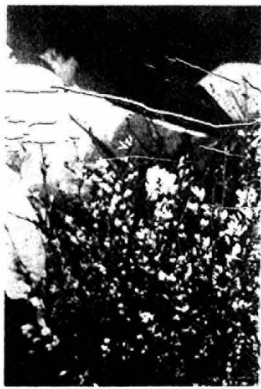
春を呼ぶ花 むる咲きサクラ