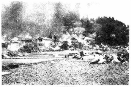
富田の大火 住家17非住家9全焼