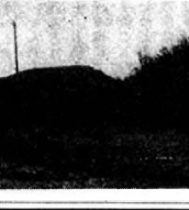
(写真「広ケ野の土塁」)

今年から、歩こう会を催し ますので、どなたでも参加に 参加ください。 ▲時間：六月八日(水) ▲時間：前六時～七時(水) ▲集合：前六時半途中へ 先着順公民館 ◎今回は五城目町歩こう会の発 足になるので、児童部におい て若干語を合をします。