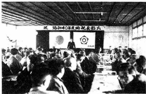
昭和40年度納税表彰式