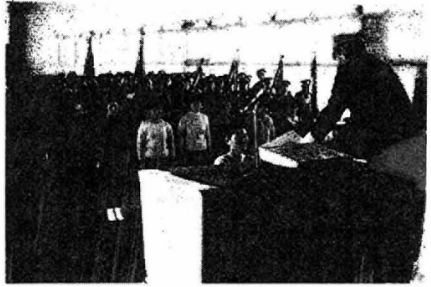
新春をかざる消防出初式、団員335人が一同に会して、団結を誓いあった。席上、上恋地婦人消防隊をはじめ個人136人、団体7が表彰されました。