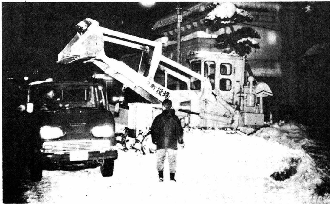
積極的に除雪にとりくむ