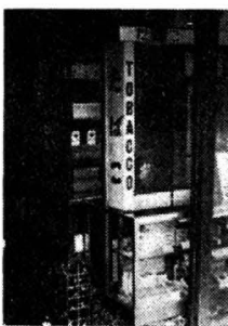
たばこは町内の店から 買います

●春とともに新しい生活。新しい学校、新しい学級、新しい職場、子どもたちはそれぞれ新しい環境に入つていそいそしている時です。