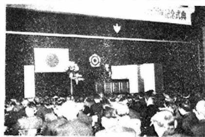
特色ある町づくりをと激励する小畑県知事

加賀谷町長からは、合併十五年を終った新町建設の歩みを省りみて、このたびは名譽町民の称号を贈った長と渡辺彦兵衛氏をはじめ、諸先輩のご努力に敬意と感謝の意を表し、高度経済成長下における本町の将来を展望しながら、町の