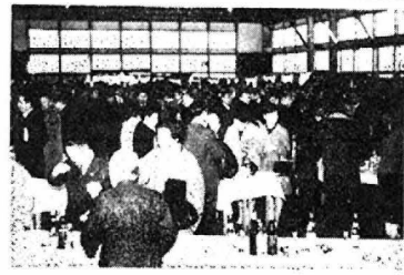
なごやかな祝賀会の一駒