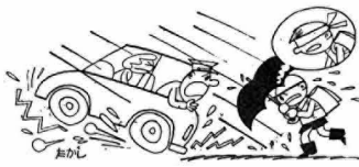
傘の中は目かくしするも雨期

一方、歩行者も横断歩道や歩道橋による正しい横断を心がけるとともに、歩、車道の区別のない狭い道路では、右側通行を励行してふだんより車への注意を十分すること。あなたもわたしもいつも心に交通安全