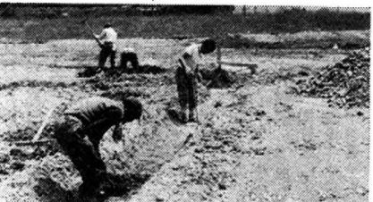
9月6日五小グランド開き・全町体育祭をメドに、急ピッチで進められている。