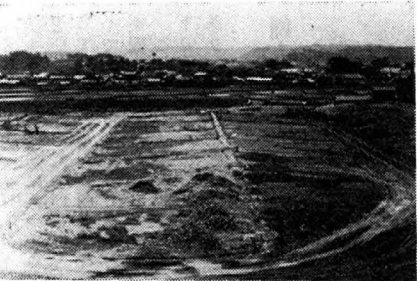
▲全景をあらわしたグランド排水工事も慎重