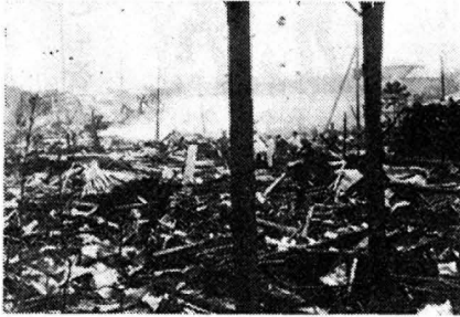
新町火災焼けあと