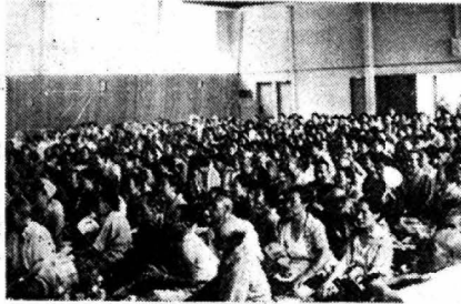
暑さにもげず超満員

7月26日老人クラブ会員が一同に会して小畑知事夫人の講演、会員による演芸などたのしい一日をすごした。