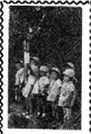
暮しのノート 暮しのノート 暮しのノート

障害の区分 視覚障害 聴覚障害 平衡機能障害 上肢不自由 下肢不自由 体幹不自由 心臓機能障害 呼吸器機能障害 障害の級別 一級から三級および四級の二級および三級 一級、二級の一および二級の二級 一級から六級までの各級 一級および二級の各級 一級および三級の各級 一級および三級の各級