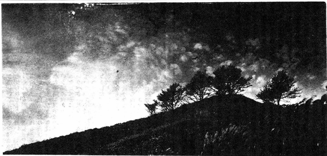
五城目町観光展から