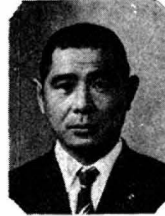
昭和四年生 四十一才 駒沢大仏 教科卒 四十一 年から二