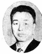
大正十四年生 四十六才 東北大医 学部卒 三十七 年から三