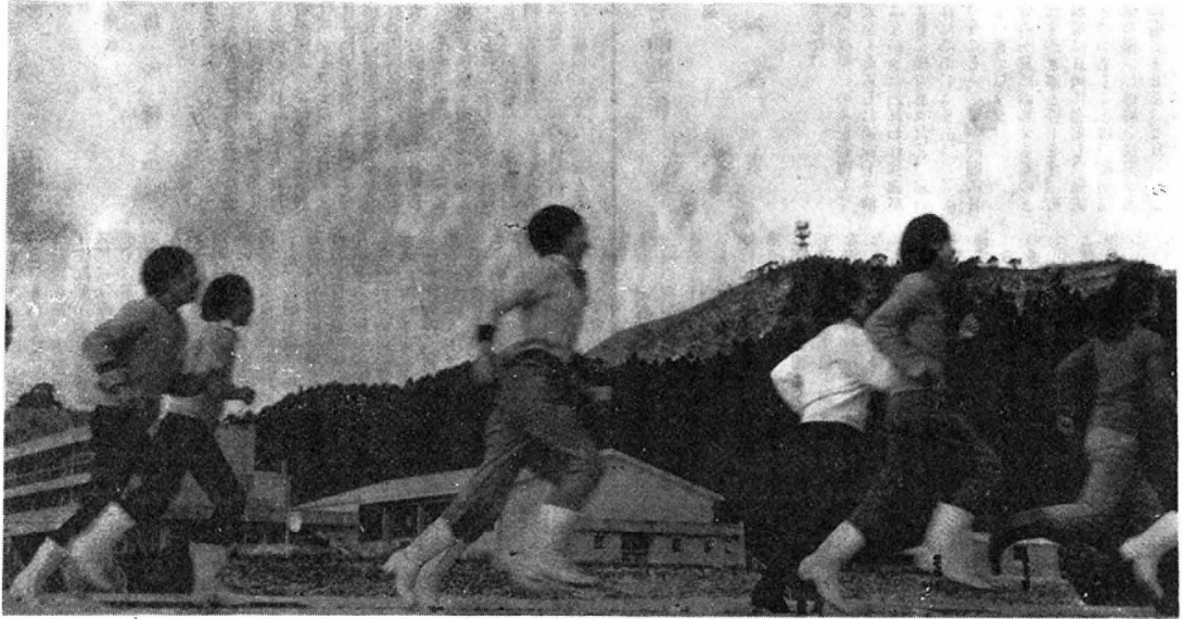
は ば た く 若 い 芽