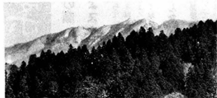
仁別からながめた初冬の太平山