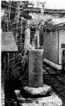
部落の産土神の稲荷神社

馬場目川下流に沿って、純農村として拓けたこの村は、約五十ヘクタールの田地を基盤とし、たい米づくりに励み、村人はよく協力し合って農作業にいらして来た。大正年間共同排水・共同作業で郡農会表彰を受け、また水稲立毛(多収穫)で一等を授賞するなどの、勤儉力行の村として伝統的なものがうかがわれる。 昨年、稲作集団報償に敢然としていども、部落を挙げて一致協力幾多の困難に打ち克つて、農事農林大臣賞と果の特別賞(二百万円報償)の栄光に輝いた。また父老の農業に対する、ひたすら努力力が現代に結実したものと、いえよう住みよいく村づくりに今一歩、新道