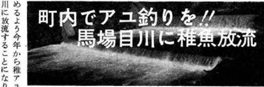
町内でアユ釣りを// 馬場目川に稚魚放流

川魚の王としてその風味が珍重され、順のため、アユの採集がおくれている。アユは、七月に入ると県内でもあちこちの河川が解禁となる。この河川が解禁となつた後、真夏の太陽の下で大人も子供も一踏になって水とたわむれながらアユ採りに興じている。馬場目川は、以前には大量のアユがのぼり、町民の貴重な蛋白質源となつた。しかし、真夏の太陽の下で大人も子供も一踏になって水とたわむれながらアユ採りに興じている。馬場目川は、以前には大量のアユがのぼり、町民の貴重な蛋白質源となつた。しかし、真夏の太陽の下で大人も子供も一踏になって水とたわむれながらアユ採りに興じている。