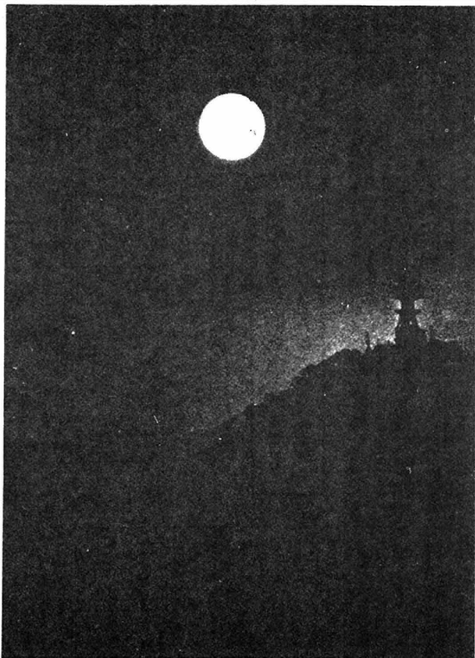
月みればちちにもこのそかなしけれわが身ひとつの秋にはあらねど 大江千里

それでも地球を照らす月の光の神々しさは、時間と空間を超越し見る人に過去を忍ばせ、未来を考えさせ、遠くに離れた肉身をそして愛する人を思わせる不思議な力の持主として、人々の心の中へしみじみとした情緒をいざなう。月をめぐる伝説・俗、神話伝承は、国が違ひ、人種が異なり、言葉が通じなくとも、人類共通の心の古里として、科学時代に生きるこれからも、私達の心の中で永遠に生き続けるだろう。