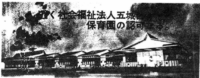
保育園完成予想図

者合開設を目標し、総事業費約三千五百万円をもって今年以来予定している五城目保育園は、法人として近き認可されることになった。 本町の児童福祉施設は、児童福祉センター、児童福祉センター西か所、に設置し、児童福祉の向上に努めている。この保育園は、法人による児童の保育に欠ける児童を対象に開設しているが、近年、町の中心部からも、これらの保育園へ通う児童は年々増加している。このことは、所定施設の増設と拡充による児童福祉の増進、児童