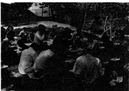
【きりたんぼに舌づつみを打つ一行】

早速「きりたんぼ」作りにとりかかった。なにしろ四十人分なので、野菜を切るのも、鍋が煮立つのも時間がかかる。 その間、子供達は？振り返って見ると、水汲みをしてくれたり、ボールをしていたり、お菓子をつまんでいた。それぞれ自由にハシヤギ回って、どうにかできあがったのが午後一時過ぎで、子供達も空腹だったらしい。