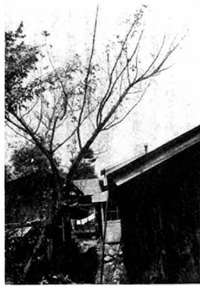
毎年同じ ところに 発生する ④防除法 デイブテ レックス 一、二回 〇倍液を 散布する 中令ごろ になると 触ればツ

このところミノウスバの被害が 町内いたるところにみられる。サ カキの葉を好んで食べる毛虫だが そのどん欲なまでの食べ振りがお