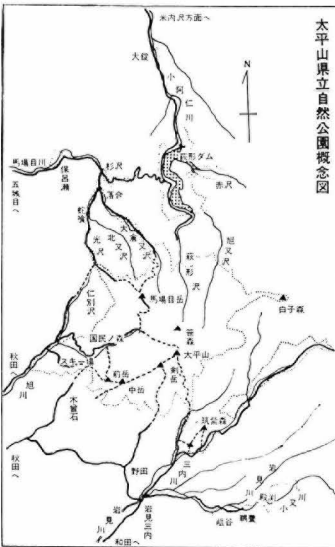
太平山県立自然公園概念図