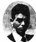
私の組合設立以来十九年になつて居ります

が、製作品目も一変して参りました、其の一例を上げますと、三本銃、四本銃、草刈機等々使用が減って居り、それも其のはず農業機械の普及に依り組合も他に進出を余儀なくされました。 其の時町当局、五城目営林署の方々のご協力に依り秋田、青森、北海道各営林局管内の営林署に進出致し今では(五)五城目刃物を全国に其の名を知らしめるまでになりました。 それも歴代の理事長を初め、組合員一同が常に組合のモットーである(和)をもつて事にあたり其の賜と深く皆々様に頭の下る思いです。だがいつも良い事ばかりでは有りません。 営林署にも機械化が余儀無くされましたが、不幸中の幸とでも言えますが、白ろう病とやらで又唐鏝、鍬頭の売上げも伸びて参り、今では毎年研究会や講習会で技術の向上に努めて居ります。 今后共皆々様のご指導ご協力を賜り度思います。