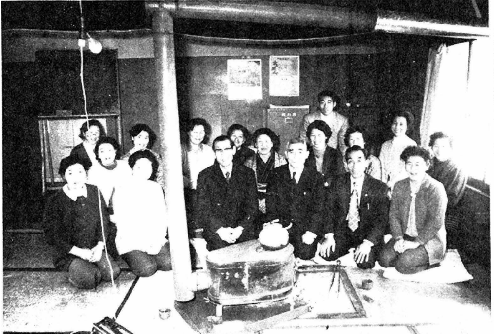
二十二年前の感激を今ここに

なお、他の税と比較してと思いますが国保料が高いという声もあるようですが、それは現在の医療費の上昇からしてご理解いただきたいものです。