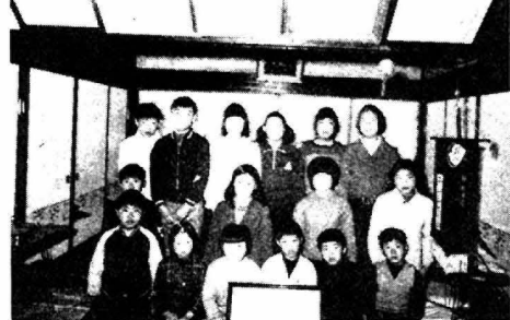
平ノ下子ども会 輝く県知事表彰を受ける ～ 3月23日 県正庁で授賞 ～

中立ての手続きについては、秋田地方裁判所の中にある秋田検察審査会事務局に問い合わせてください。