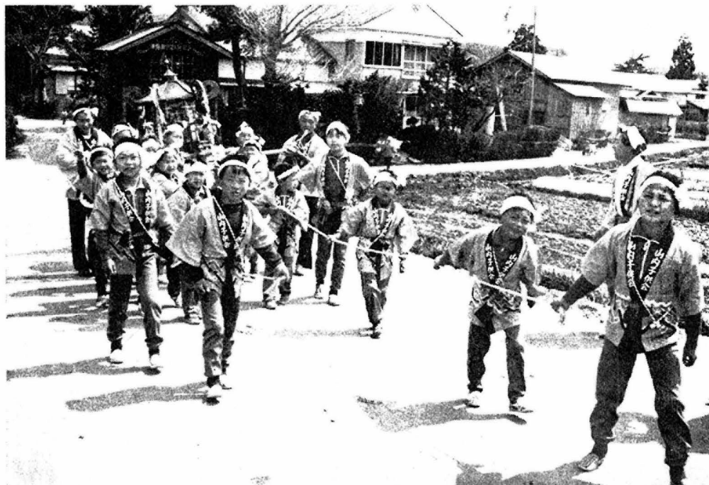
写真は子供みこして村中をねり歩く山内子供会

5月5日は子供の日、そして町内の農村部は祭典でもあった青い空に白い雲、薫風をはらんでユラユラリ泳ぐ「鯉のぼり」その下を青のしるしはんにんに白鉢巻、「ワッショイ」のかけ声りしく、子どもみこしは行く。