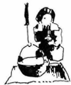
総合指導センター