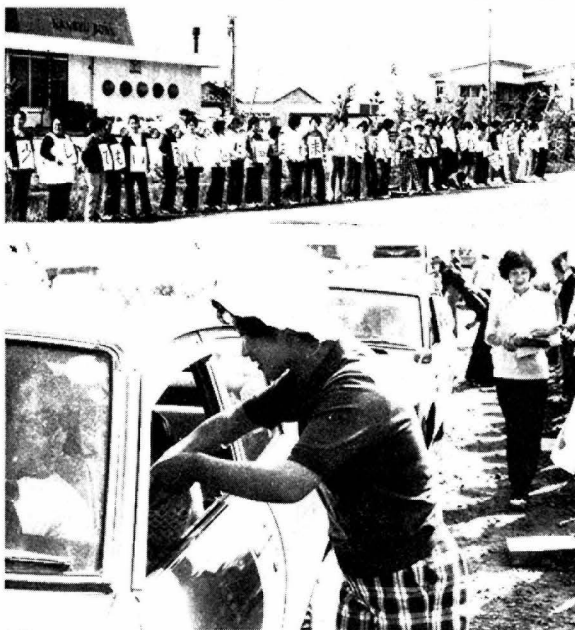
写真は川若妻会交通安全安全キャンペーン

去る十一月七日(土)日(日)にわたって演劇が日本青年会館、合唱は山野ホールで全国青年大会がおこなわれた。秋田県代表チームとして参加した、富津内青年会演劇「すず虫の里」が、全国の代表とその演技を競いあつた。普段の練習の成果が実り、町の自然を守ろうとする創作意欲が高まり評価されて、見事優秀賞の栄誉に輝いた。 一方、馬場目青年会員で構成された合唱チームは、課題曲「秋を呼ぶ歌」自由曲「雪が降る」を發表したが、この二曲の間にはさだ「雪つ子」が好評を博し審査委員長から満点を戴く程であった。惜しくも努力賞に終わったが、秋田県の代表が合唱の部において、努力賞を獲得したのは初めてで、今後の活躍が楽しみなチームとして注目を集めた。 なお何時の時代も青年会につきまとう「活動時間」の少ない条件を見事克服して、全国のトップレベルに踊り出た青年会員の努力とそれを支えてきた関係者各位に深く敬意を払い、久々に放つた五連青のクリンヒットに心からの拍手を送りたい。