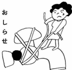
水道管が氷る季節です

①青色申告がやさしくなりました ・所得三〇〇万円以下の方まで、現金主義会計ができるようになりました。 ②記帳はなぜ必要なのでしょう ・企業の経営診断ができ経営の合理化と企業の発展に役立ちます ・金融機関から融資を受ける際にも、またいろいろと関係先に出す書類にも正しい数字が必要で