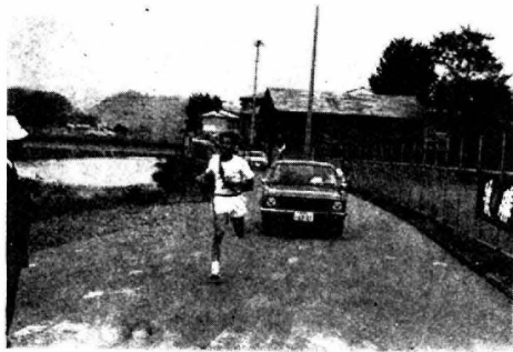
五城目陸友会荒川アンカー健闘

第十八回森山登山競技会が、去る十一月三日文化の日に参加選手二百名を得ておこなわれた。今年から町功労者表彰式場にあたる五一中のグラウンドにての出発点を移動したため、選手は走行距離五・七キロメートルに覇をかけた健闘を競った。なお今年は北秋田郡上小阿仁中学校の選手も参加し健闘している。