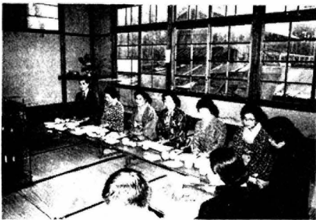
岩手県矢巾町婦人会来町地元婦人会と交流

広く県外の先進地婦人会活動の状況を視察、研修のため夫る11月19日に岩手県矢巾町婦人会幹部8名と引率者1名が来町した。