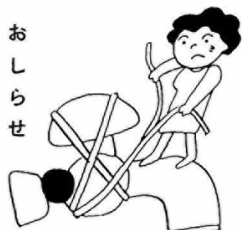
水道管が氷る季節です