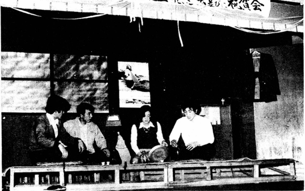
「鈴虫の里」を熱演する青年会員

<ミニ知識> 生活保護法 保護の種類には次の7つあります。 ・生活扶助=衣食など日常生活に必要なもの ・教育扶助=義務教育に必要な学用品、学校給食費 ・住宅扶助=家賃、補修など住宅維持費 ・医療扶助=①診察 ②薬剤または治療材料 ③医学的処置、手術およびその他の治療、施術 ④病院、診療所への収容 ⑤看護 ⑥移送 ・出産扶助=①分べんの介助 ②分べん前後の処置 ③脱脂綿などの衛生材料 ・生業扶助=①生業に必要な資金器具、材料 ②生業に必要な技能の修得 ③就労に必要なもの ・葬祭扶助=①検案 ②死体の運搬 ③火葬または埋葬 ④納骨など葬祭のために必要なもの