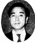
期中学生活も終り、冬休みがやってきました。

冬休みはクリスマス、年の暮れお正月などの行事があり、家族ぐるみで過ごす時間が多い、家族のよさを味わうことができるよい機会です。またスキー、スケート、そりなどの雪遊びをすることで、からだを鍛えたり、これまでの学習をふりかえって不十分であった所を復習し、自主的に学習する力をつける絶好の機会です。この冬休みを楽