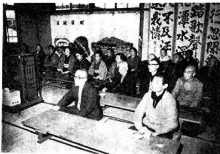
率浦大学で町の福祉施策を学ぶ

なお、話し合いの内容をスベードの関係ですべて掲載できないので、司会者の発言を五連青の意見として、助言者の発言を主体にまとめた。