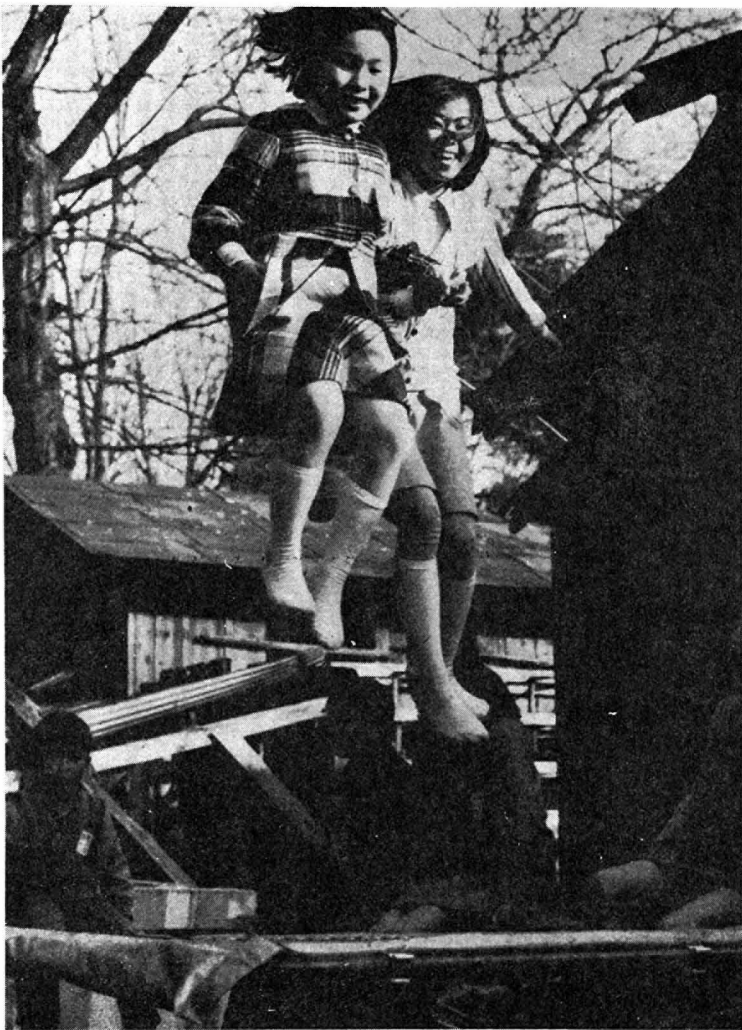
青空のもとトランポリンをたのしむ子ども達

うしたわけでありませう。この本は今も読書好きの子ども達を魅了してやまないものがあります。それは歴史を感じさせない冒険があり、夢があるからです。試行することが育見だといわれています。この写真の中の子ども達は、順番を決めて実に楽しそうにトランポリンで空中に舞っていました。自由な子ども達、五日には少し考えてみませんか。