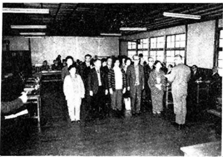
五城目町文学祭日常性の作品化

しかしながら、本町の体育協会は設立以来殆んど自主財源をもたず、町の援助にたよりながら細々と活動を続けているような状態であり、本来の自主独立性に欠けていたこと