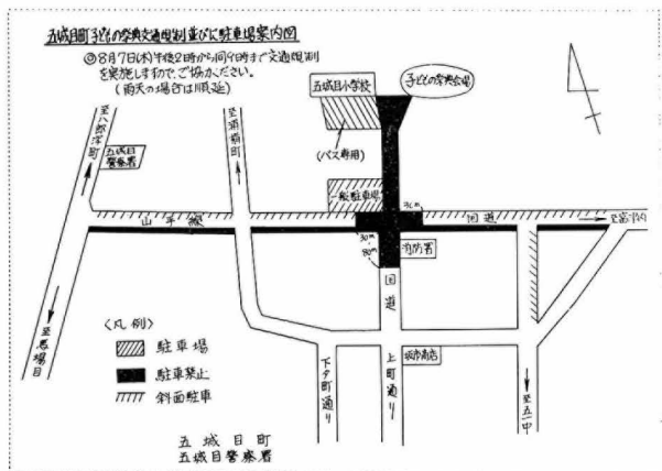
子どもの祭典交通規制図及び駐車場案内図