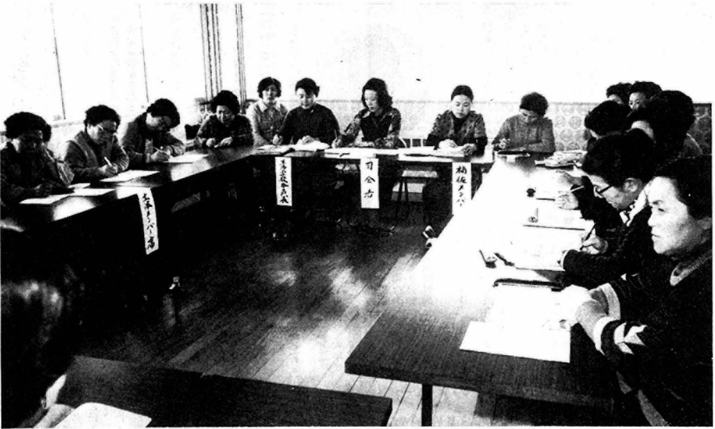
業者と熱心に話し合われる生活学校のみなさん

五城目町生活学校では、去る2月23日町民センターたいうの間で、豆腐、つくだに製造業を招き対話集会を開いた。