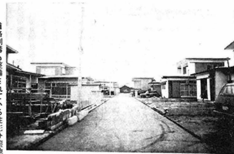
道路測溝も整備されている住宅分譲地 (上田町附近)

◆公共用地 ・二六、八五一㎡ ・六百六十一万 八千五百五十円 (九) 計 二六、八五一㎡