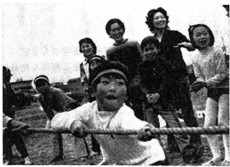
綱引に一人前の実力を発揮

田町町内会第十二組(上田町会)では、去る四月十八日(日)午後九時半から、今年度第八回目の運動会を開催しました。 当日は若干雲の流れもあつたが晴間が多くなり早春としては申し分のない運動日和でした。 上田町会二十九世帯から六十人ほど参加してドレコウすくいと等十五種目にあつた熱戦を展開し、一位緑色(第三班)が二七五点で二位と一点差で優勝し午後三時半ごろ無事終了しました。