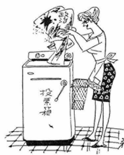
一洗ママは政治のお洗濯

●不在者投票について 不在者投票は、選挙の当日正当な理由によって投票所にもむいて投票することができない選挙人のために、投票日の前にあらかじめ