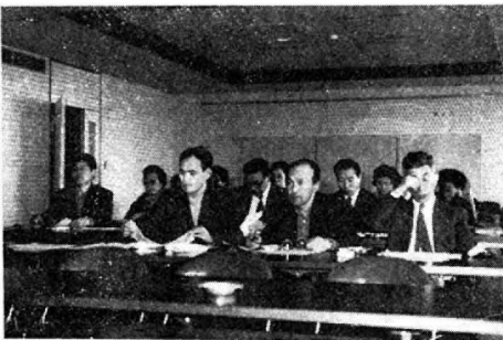
熱心に講評を受ける参会者