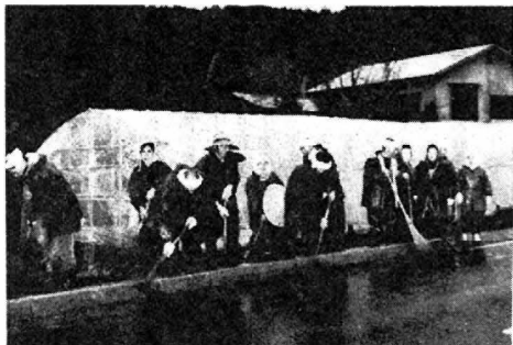
雨の中、元気に奉仕作業に励む乙種老人クラブの人たち