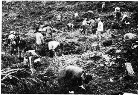
来世紀に期待をこめて、植樹する参加者

で、製材、家具、建具、補骨などの業種が地産経済の担い手となってきた。この元をただすと、植樹事業の推進がいかに重要な役割を果たしているかがわかる。緑は共通の資本と財産である。