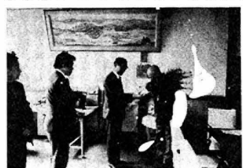
矢場崎町内会町民センターに緑の善意