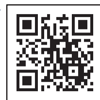
「コロナワクチンナビ」 二次元コード