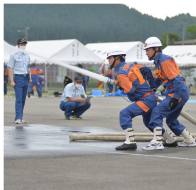
令和4年度町消防訓練大会の様子

5月28日、五城目町消防本部において令和5年度小型ポンプ操法伝達講習会が開催されました。