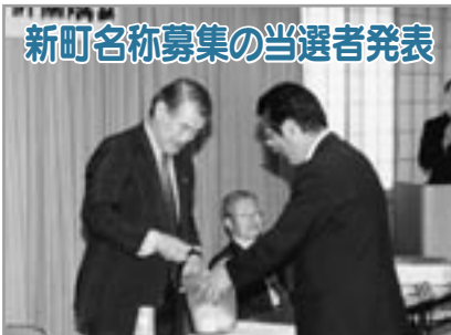
新町名称募集の当選者発表