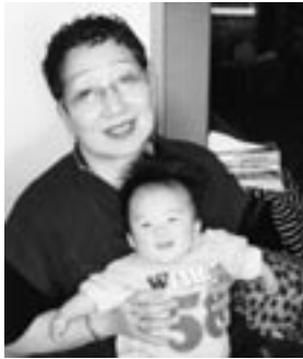
お孫さんと一緒に