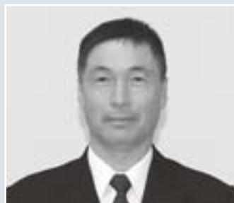
消防団分団長 □□さん(久保)

このたび、3月7日付けで町内消防関係者2人の方が表彰されました。おめでとうございます。