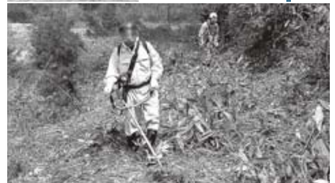
軌道敷跡の草刈り作業などを行いました。

今回は、ネコバリ岩周辺から北ノ又集落周辺までの軌道敷跡（約一・五キロメートル）の草刈りや倒木処理の作業が中心で、清流の会の会員のほか、町長・副町長をはじめ役場職員も二十五名ほど参加して実施されました。