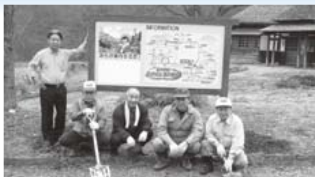
案内看板を設置した清流の会の皆さん

この案内看板は、県のモデル事業で制作したもので、それぞれ異なる三平のイラストが描かれています。清流の会では皆様のお越しをお待ちしております。