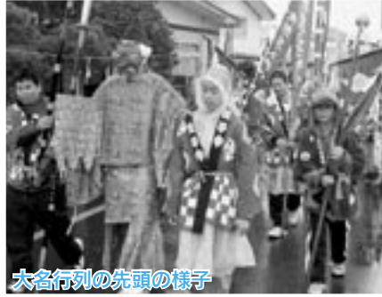
大名行列の先頭の様子

大にぎわい！春の五城目 勇壮な舞を披露する「番楽競演会」が五月十六日、旬を彩る「山菜まつり」と「大名行列」が十七日に行われました。十六日、十七日は本町部の祭典があり、両日を通じて多くの来場者でにぎわいました。