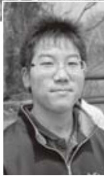
生徒会長の□□□□さん(3年)