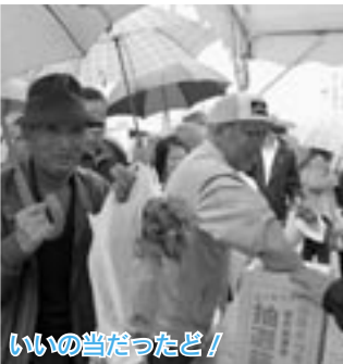
いいの当たったと！