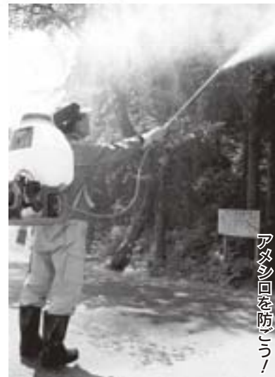
アメリシロを防ごう!