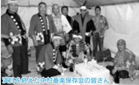
演目を終えた中村番楽保存会の皆さん

山菜まつりでは、アイコなど旬の山菜が並び、山菜が当たる抽選会やだまこもちのコーナーなどに、多くの人が列を作っていました。↓