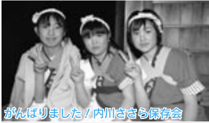
がんばりました！内川ささら保存会

番楽競演会では山内番楽保存会、中村番楽保存会、内川ささら保存会が演目を披露しました。↓