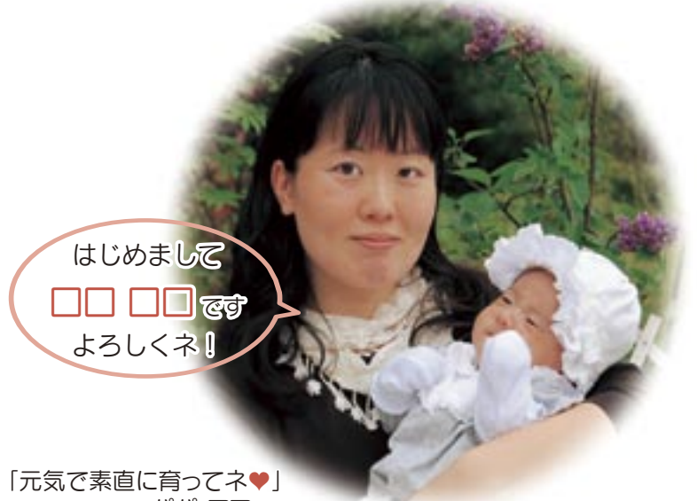
「元気で素直に育つてネ♥」 パパ、ママより