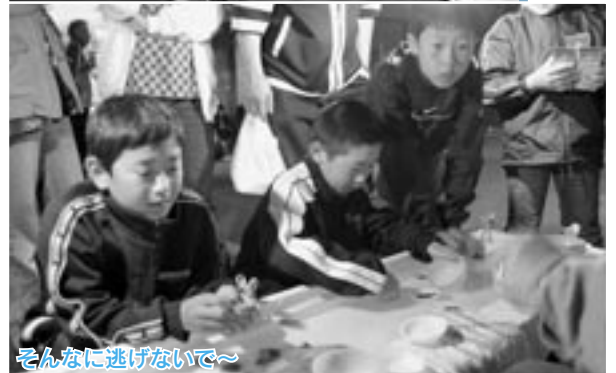
そんなに逃げないで～