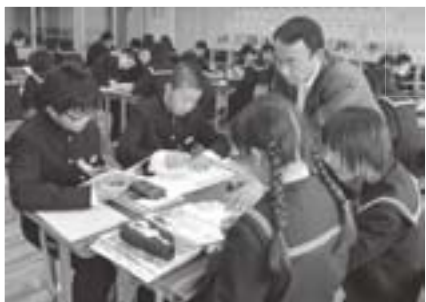
授業風景 (㊦2年生、㊦3年生)