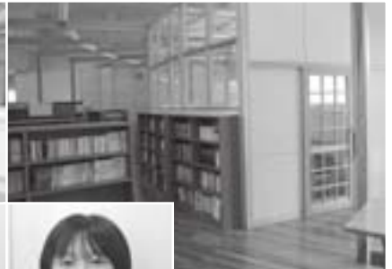
□□ □□さん (2年A組)