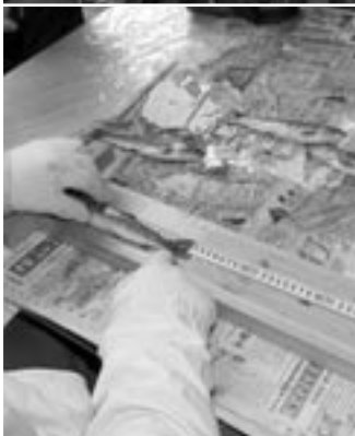
審査・検量の様子

四月二十六日、「みちのく溪流釣り大会in馬場目川2009」が、馬場目川上流部を主会場に開催されました。大会には県内外から三十五人が参加。釣り上げたイ