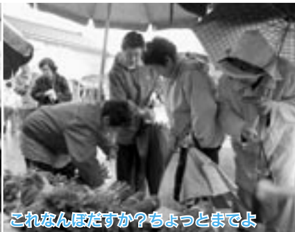
これなんぼですか？ちよっとまでよ