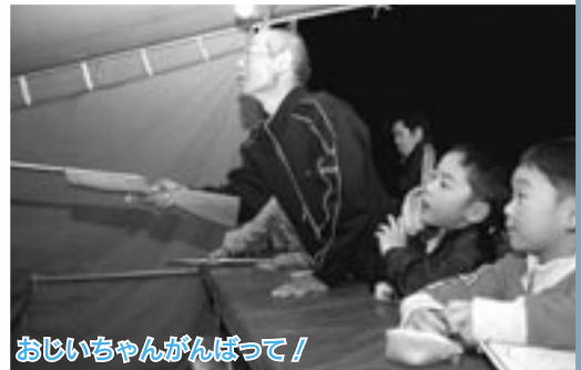
おじいちゃんがんばって！

山菜まつりでは、アイコなど旬の山菜が並び、山菜が当たる抽選会やだまこもちのコーナーなどに、多くの人が列を作っていました。↓