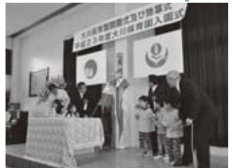
新しい看板がお披露目

当日は、新入園児3名と在園児、保護者のほか、法人関係者や来賓など約80名が出席。開園式では、在園児らによる新しい看板の除幕式も行われ、大川保育園の新たなスタートをみんな