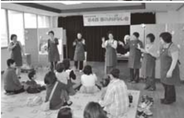
「五城目おはなし会」の皆さん