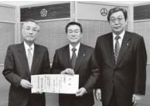
石川区長に目録を手渡しました。

東日本大震災の影響で、姉妹都市千代田区でも一時、水道水から乳児の飲用基準を超える放射性物質が検出されたため、町では3月27日に非常用飲料水として、ペットボトル入りミネラルウォーター(500ml:14,400本、2ℓ:3,000本)を送り、飲料水確保をサポートしています。