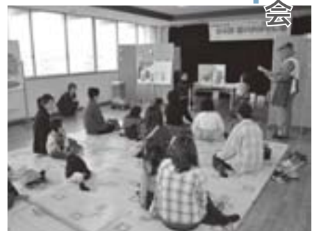
大型絵本で「おはなし」を楽しむ

当日は、親子連れなど約20人が参加。大型絵本やパネルシアターのほか、エプロンにキャラクターを張り付けておはなしを進める「エプロンシアター」、そして歌や手あそびなども交えた盛りだくさんの内容に、参加者の皆さんは一緒に歌ったり、質問に元気に答えたりと、みんなで「おはなし」を楽しみました。