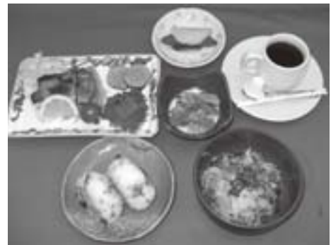
悠紀の国五城目の「秋田御前」