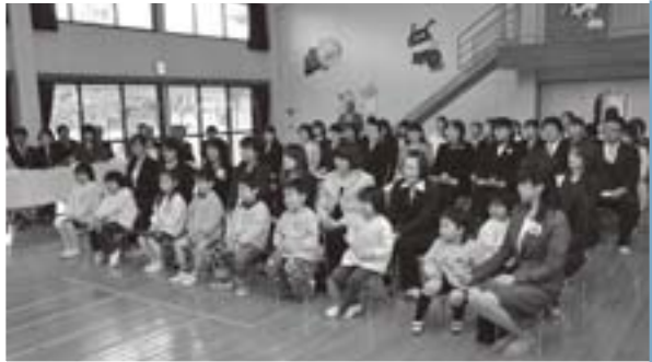
大川保育園の子どもたち

これまで町が運営してきた大川保育園が、4月1日から社会福祉法人キッズハウスもりやま（原田啓藏理事長・前社会福祉法人五城目保育園）に移管され、4月10日に開園式と入園式が行われました。