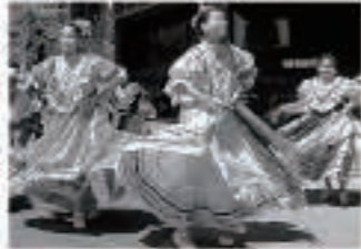
5月5日はメキシコの文化や誇りをお祝いしています

Today it is celebrated in America as a way to celebrate Mexican culture and pride. Many people go to festivals, eat Mexican foods, and sing and dance to Mexican music. The holiday is not a National Holiday in Mexico, but it is still observed by many towns and cities.