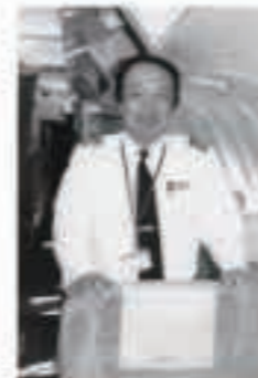
ふるさと五城目町の上空を飛ぶのが楽しみです

近い将来、五城目出身の新しいパイロットが上空に飛び立つ日がくることを心から期待したい。