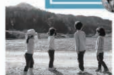
娘やお友達、移住候補者の子どもたちと、収穫体験をさせていただきました!