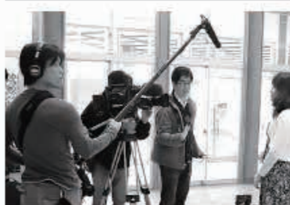
活動拠点・地域活性化支援センター(旧馬場目小)にて撮影中。

私は、一人の母親という視点から、五城目で子育てができることは本当に幸せだと感じています。最近の娘は、たんぼぼやくしを摘むのに大忙し。豊かな自然の中、地域の皆さまや、子ども園にてたくさんの方の愛情を注いで育てていただいています。また、わらしべ塾や五中の給食といった子ども関連