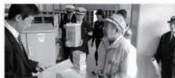
4月10日、町交通指導隊、町交通安全母の会、五城目警察署協力で、町交通安全協会による「学校施設訪問」が行われました。

春の交通安全運動がスタートします。連休明けの疲れ、気持ちの緩みから思いがけない事故に巻き込まれる可能性があります。ドライバーの皆さんは、特に子どもや高齢者を見かけたら安全運転に心がけましょう。