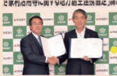
▲9月24日 秋田銀行と「空き家の利活用等に関する地方創生連携協定」を締結。