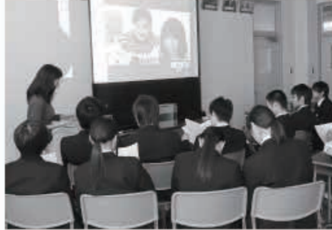
2月に来町予定の明治大学の学生とスカイプでお話しをする五高生

◆「未来を生きる私を考えるプロジェクト」 最近、お手伝いさせていただいている五城目高校×明治大学国際日本学部の連携授業「思いっきりアクティブラーニング」。 生徒たちに、多様な対話の機会や地域の未来を考えるきっかけを、と考えられてきた県立五城目高校と、地域での