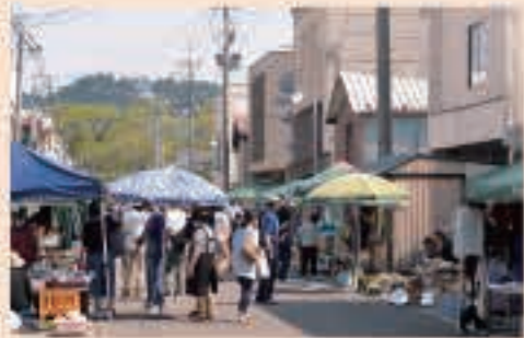
▲定期市のない日曜日に、試験的に臨時日曜朝市を開催。