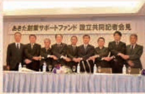
▲10月1日 創業を支援する「あきた創業サポートファンド」が設立。