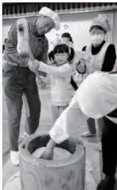
重い杵はおじいちゃんと一緒に持ちました

12月2日、もりやまこども園で、おじいさんやおばあさん、保護者会が協力して、もちつき会が行われました。