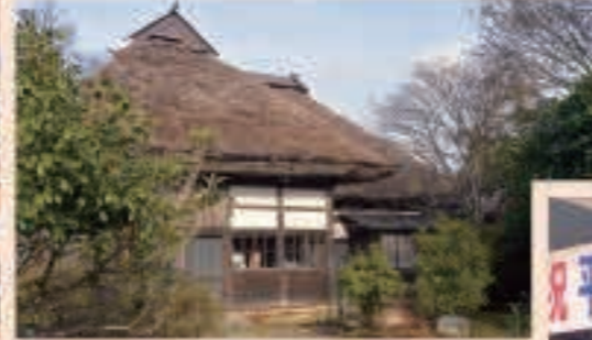
▲5月 クラウドファンディングによるシェア・ビレッジ町村が開村。