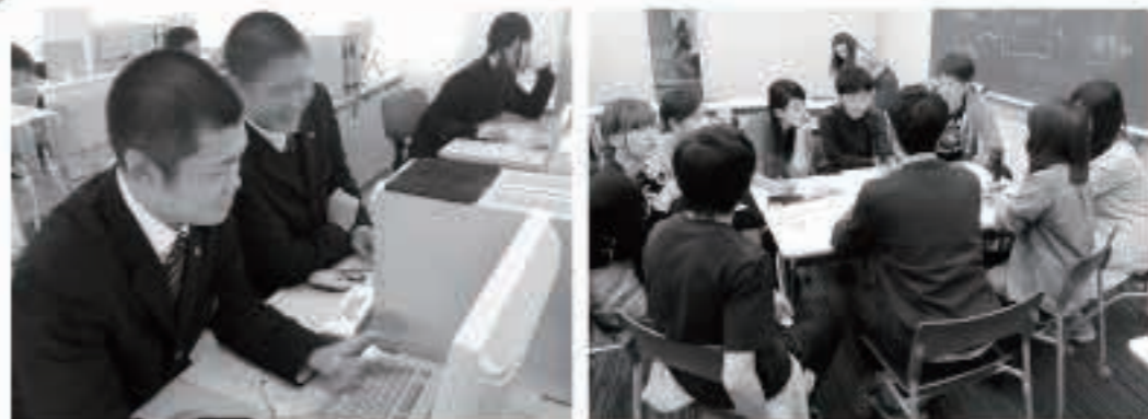
県立五城目高校でお手伝いさせていただいている思いっきりアクティブラーニング