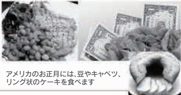
アメリカのお正月には、豆やキャベツ、リング状のケーキを食べます

Everyone, thank you very much for everything this past year, as well as the year ahead.