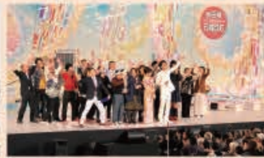
▲10月18日 広域五城目体育館で町制施行60周年記念NHKのど自慢を開催。