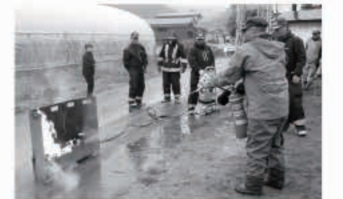
昨年11月8日に実施した黒土町内会地域支援隊「め組」の防災訓練