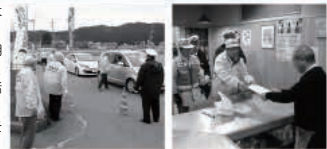
町交通安全協会では、12月4日に飲食店巡回訪問、12月13日に年末の交通安全キャンペーンを、町交通指導隊、五城目警察署の協力で行いました。

1月10日(日)は「110番の日」です。緊急時以外の相談・連絡などには、警察相談専用電話(☎864・9110)または#9110をご活用ください。