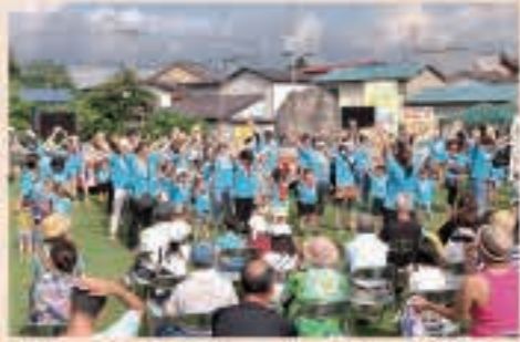
▲8月15日 雀館運動公園などできょうとこまつり2015が開催。

昨年、広報ごじょうめはいろいろな行事や話題などをお伝えしてきました。主なものを集め2015年を振り返ります。今年も広報紙の編集にご協力くださいますようお願いいたします。