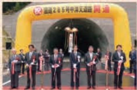
▲11月6日 トンネルや橋を整備した国道285号中津又道路が開通。