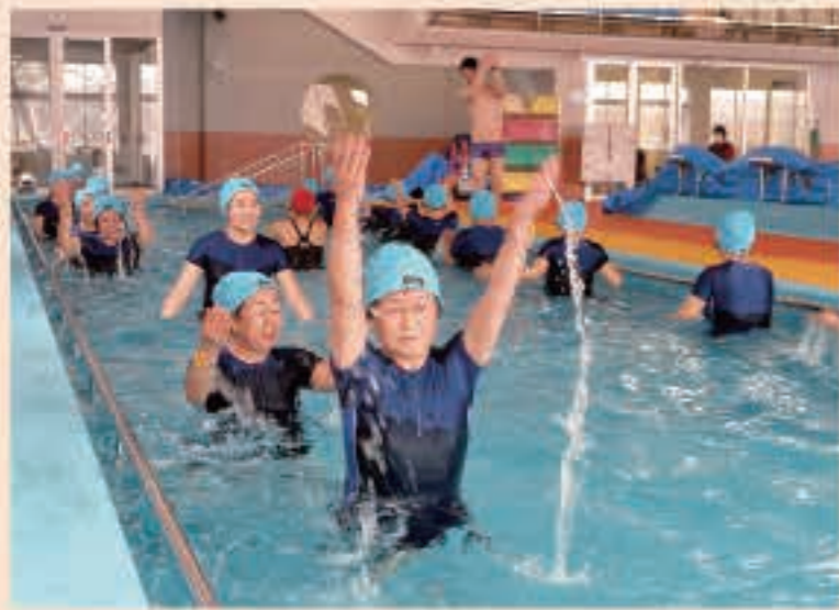
▲2月25日 秋田県市町村未来づくりプログラム・五城目プロジェクトによる大規模改修をしていた屋内温水プールが完成。専用の水中歩行用のプールを備え、水泳のほかに水中運動教室などを開始。