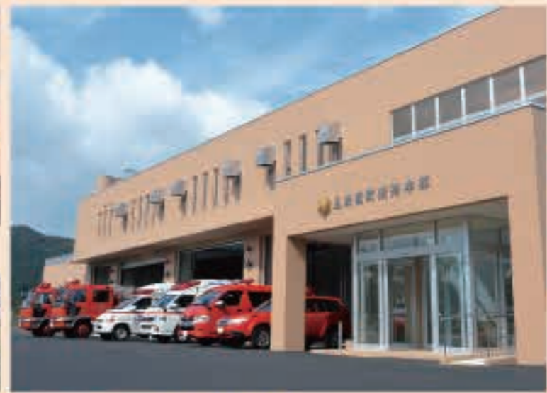
▲10月21日 富津内下山内に町消防庁舎、訓練塔が完成。ドクターヘリなどの臨時離着陸場も併設。