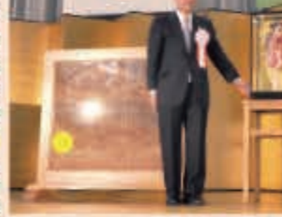
▲11月3日 町制施行60周年記念式典を開催。60年の歩みを振り返り、新たな町の発展を誓い合う。