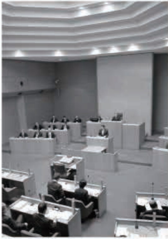
平成27年12月7日から11日まで開催された12月議会定例会