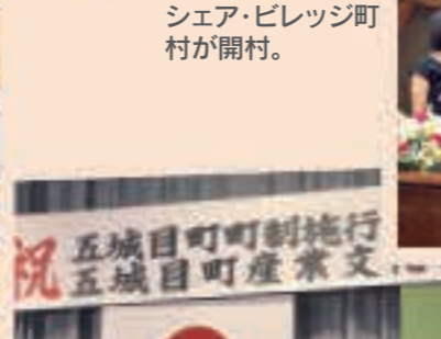
▲11月3日 町制施行60周年記念式典を開催。60年の歩みを振り返り、新たな町の発展を誓い合う。