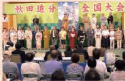
▲7月12日 広域五城目体育館で第26回秋田道分全国大会を開催。