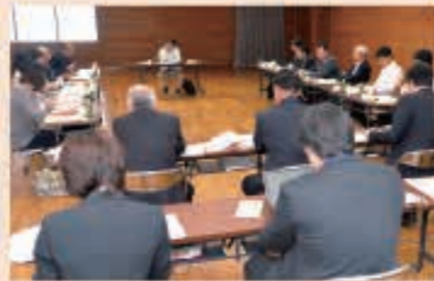
▲8月6日 第1回まち・ひと・しごと創生総合戦略策定審議会議を開催。