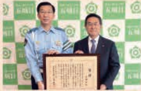
▲8月12日 交通死亡事故ゼロ、1,000日を達成。現在も継続中。