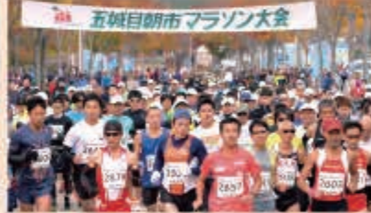
▲10月25日 五城目朝市500年記念マラソンを開催。1,022人が参加。