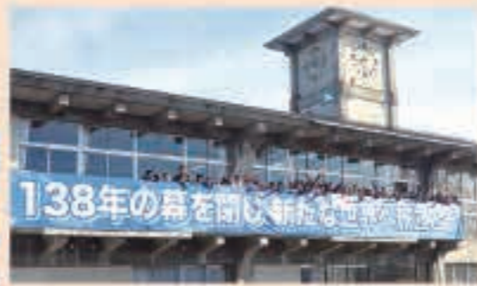
▲3月31日 大川小が138年の歴史に幕。4月からは五城目小に統合。