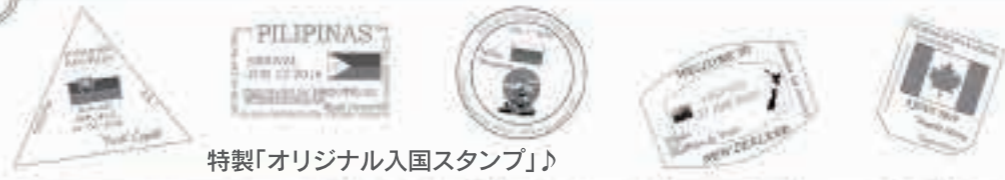
特製「オリジナル入国スタンプ」