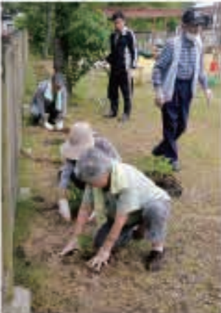
秋桜の花が咲くのが楽しみです

7月2日は、保護司会・更生保護女性会などの皆さんが朝市通りで、犯罪や非行の防止を呼びかけました。 7月1日は、「社会を明るくする運動」強調月間で、全国各地で様々な活動が開かれています。