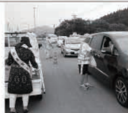
昨年度キャンペーンの様子。

夏の交通安全運動がスタートします。夏の行楽のシーズンを迎え、車を運転する機会も増えます。同時に、気候もよく自転車や徒歩での外出も増える時期でもあります。外出の際は、安全運転、安全確認を忘れずに! 町交通安全協会では、8月7日(日)午後2時から、大手原久商店前でキャンペーンを実施する予定です。