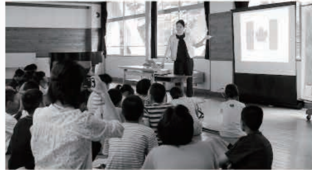
五小の先輩による授業も!