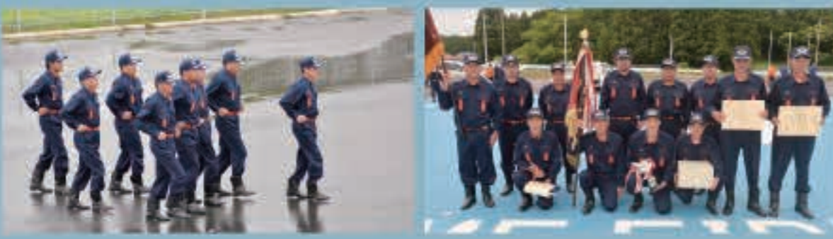
規律訓練の部で優勝した10分団の皆さん