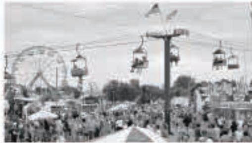
ステートフェアにはカーニバルライドが特設され、遊園地のようになります

昔は、ステートフェアには毎年、人々が集まって州の農作物を展示していました。ステートフェアは一般的に、州の農作物や家畜、郡のフェアで金賞をとった地方の料理などを品評する会でした。現在のステートフェアは、多くの人を集めるために、様々なカーニバルライドや遊園地ゲームなどがあります。