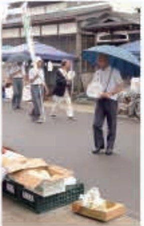
うちわを配りながら犯罪や非行の防止を呼びかけました

7月2日は、保護司会・更生保護女性会などの皆さんが朝市通りで、犯罪や非行の防止を呼びかけました。 7月1日は、「社会を明るくする運動」強調月間で、全国各地で様々な活動が開かれています。