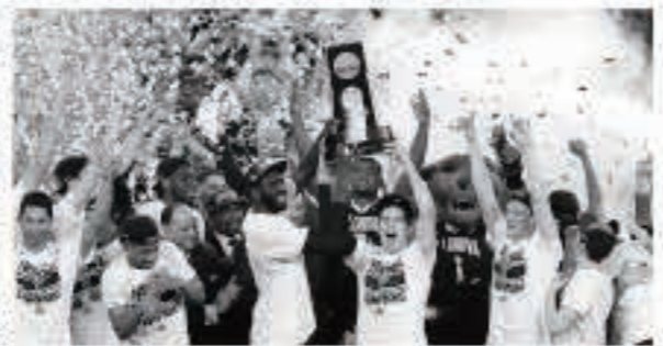
去年はペンシルバニア州のピラノバ大学ワイルドキャッツが全米選手権で優勝