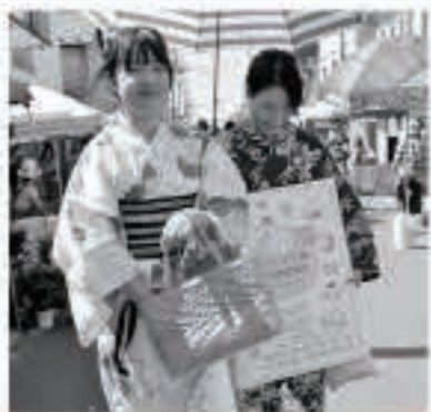
「浴衣de朝市プラス+」や「仮装de朝市プラス+」にも参加。活気に満ちた朝市通りでした

同時に、活動拠点のババメベース（町域活性化支援センター）は、開設当初3社だった入居企業が13社になりました。県外からの移住者だけでなく、五城目町内からの起業も複数生まれるなど、教育・農林業・デザイン・人材育成・観光・ものづくり・ITといった多分野多業種の「ドチャベン（土着ベンチャー）」、すなわち地域に根ざした新しい仕事が増えていきます。起業家や企業の集積拠点として出会いと創発の場となっているほか、各種企画も行われ、県内外の視察も増えるなど年間約5,000人が訪れています。