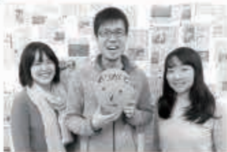
皆さん、ありがとうございます これからもお世話になります

着任当時の「協力隊通信」を読み返していたら、「一緒に楽しい妄想を繰り広げませんか？」と書かれた、協力隊