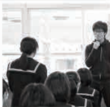
五城目一中で地域おこし企画を好評。激励！子どもたちの成長が楽しみです

や、懐かしい2000人が集まった野鳥の森での「パリーイー」イベントなど色々かわらせていただきました。活動すればするほど、移住者であれ、町の人であれ、女性であれ、若者であれ、一人一人が自分や町の魅力に気づき、可能性を發揮ができる環境を作ること、お互いに応援しあうこと、協力しあうことの大事さを実感しました。そうした人がたくさんいる町が魅力にあふれていないはずがありません。これからも、様々な形で、ときには女性の視点を生かしながら、秋田にある資源を輝かせ発信したり、秋田に暮らす方々の中にある可能性が開花していくための仕組み作りを携わっていきたいと思っています。