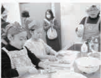
地域の皆さんが講師となり、子どもたちと交流を深めた「わらしべフェス」

高校が9年連続26度目の優勝を飾りました。また、地元の五城目高校のレスリング部員は、自分の個人戦のほか、準備、そして後片付けと大活躍しました。