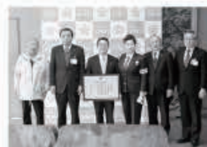
表彰状を手にする関係者の皆さん。みんなで飲酒運転・交通事故をなくしましょう

飲酒運転等追放競争は、各市町村の住民の飲酒運転または飲酒運転が原因の事故の件数などを点数化し、これに対する当該市町村の運転免許人口の割合により順位を競うものです。なお、重大な事故ほど減点が大きくなります。 当町の平成28年の結果は、全県25市町村中4位の結果となり、2月22日に県知事から上位入賞の表彰を受けました。