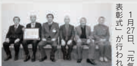
秋田地域振興局長表彰を受けられた浅見内活性化委員会の皆さん

1月27日、「元氣なふるさと秋田づくり地域活動表彰式」が行われ、「浅見内活性化委員会」が秋田地域振興局長から表彰されました。浅見内活性化委員会は、1人暮らしの高齢者世帯等を対象に買い物バスの運行や雪かきなどの日常生活の支援、「ふれあいサロン」や「お互いさまスーパード」の運営など、地域の支え合いの活動を行っています。