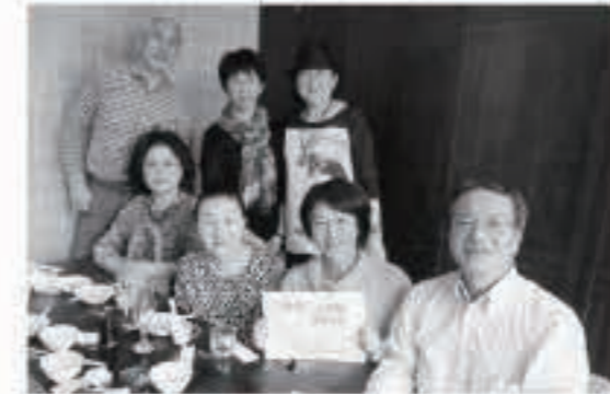
内川小同窓会の「ゆのこ会」を持っているのが私です(有楽町KAMONNKA点で撮影)

私が子どものころは、冠婚葬祭山の仕事が一段落した時や民謡愛好会のお父さん方の集まりなどで家に人が集まる事が多かったので、よく座敷にお膳を並べ、かやき鍋を運び、お酒のお酌をしたものでした。思い返すとこういった集まりは、料理やしきたりを覚えたり、様々な事を教えてもらったりするだけでなく、近所の人が集まりお互いに助け合う場となっていたのだと感じます。