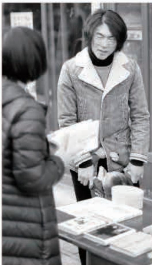
朝市でも、古書店を出店しています

高校を出て関東の大学に行き、四国で働いたのち五城目に帰りました。勝手知ったつもりでいましたが、外からの視線が入ったことで地元の見え方が変わりました。旬の食材、季節のお祭りも味わい深いと思うようになり、地元で頑張っている人に目が行くように