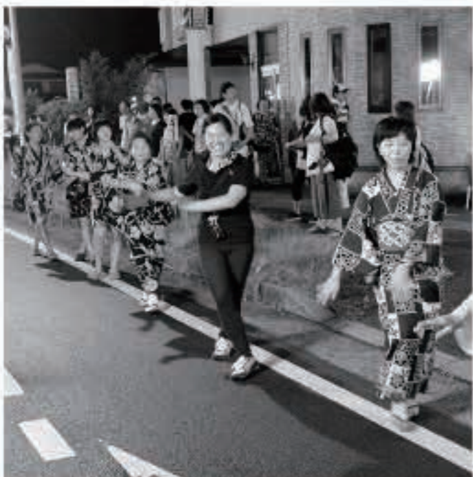
地域の皆さんと一緒に伝統行事にも参加し地域文化を継承

自分が移住するなら、町の人を楽しそうにしている所がよいと思っています。 五城目は、朝市が盛り上がり、高校生を巻き込んで色々なことを頑張っているのを見て、地域の人たちが「この町いいな、町外の人も「こういう町に住みたいな」と感じると思います。そういう意味でもこうした活動がもっと広がればいいと思っています。