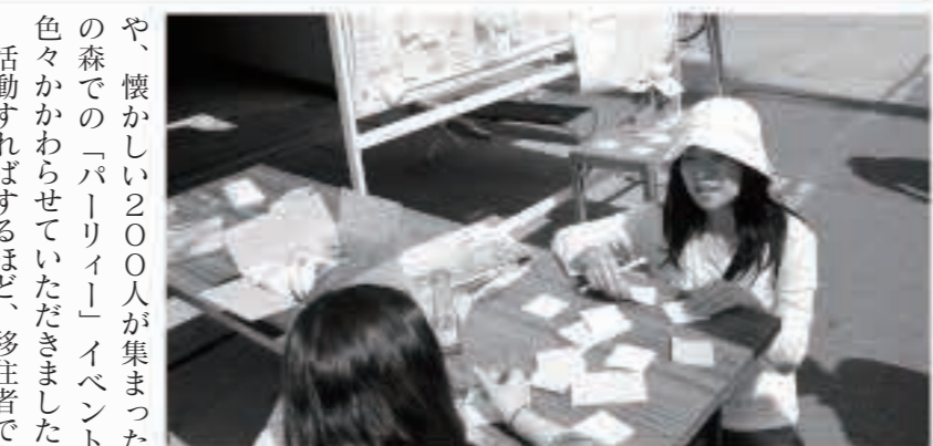
五城目町は環境に恵まれているので、次々にアイデアもわいてきます

高校生は想像以上に刺激を受けたよいうで、「寂しい町だと思っていたが、熱い町であることに気づいた」、「就職しても秋田に戻ってきたいと思う」など、嬉しい感想がたくさん届きました。