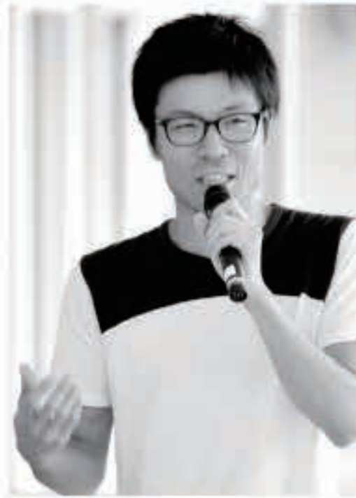
プロフィール 東京都出身。東京大学大学院修了。在学時山梨県北杜市、甲州市のオンデマンドバスの導入に尽力。前職の株式会社ガイアックスでは、学校向けネットパトロール事業の運営にかかわり、講演や授業プログラム開発、市民向け講座などを担当。2014年5月着任。