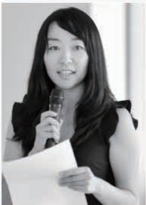
プロフィール 立教大学法学部卒業後、日本ビデオニュース株式会社でインターネット動画放送局の立ち上げ、映像記者として活動。その後、映像制作業を営んだ後、神奈川県立地球市民かながわプラザでの広報・イベントを担当。東京大学大学院情報学環学際情報学府・文化人間情報学コース修了。2014年5月着任。

かた」の企画も、根っこは同じ思いでした。この町や高校に通う若者が十分に可能性を發揮できるように人生をデザインするためのサポートとして、表現やコミュニケーションの醍醐味を演劇によって体感したり、地域に根ざし、働く大人たちと対話する機会を作りました。