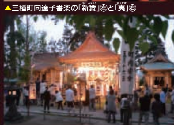
▲日暮れとともに始まった番楽競演会