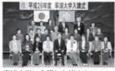
率浦大学に入講した皆さん

5月7日の朝市は、春の朝市「山菜まつり」と「ごじょうめ朝市Plus+」を開催しました。 朝市通りには、シドケやアイコなどの旬の山菜のお店がたくさん並びました。 もれなく山菜が当たる抽選コーナーや、山菜汁やだまこ鍋にも行列ができました。 「ごじょうめ朝市Plus+」も開催したこともあり、いつもながらの山菜や野菜のお店のほかに、雑貨や小物、お菓子などのお店の出店もあり、子どもが楽しんでいく姿も多く見かけました。