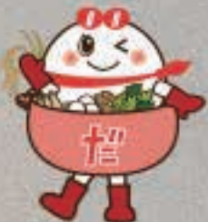
五城目町観光PRキャラクター たまごちゃん