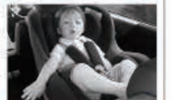
6歳未満の幼児には、チャイルドシートを必ず使用しましょう。6歳を超えても、まだ身体の小さい子どもにはチャイルドシートやジュニアシートを使うようにしましょう。

通園や買い物・ドライブなど、子どもを車に乗せて出かける時には、必ずチャイルドシートに座らせましょう。「近いから、スピードを出さないから大丈夫」と考えるのは大間違いです。思わぬ事故に巻き込まれるケースもあります。チャイルドシートを購入するにあたっては、町民の方は購入費助成(子ども1人当たり1台分、購入費用2分の1、上限1万2千円)も受けられます。詳しくは役場健康福祉課(☎852・5180)まで。