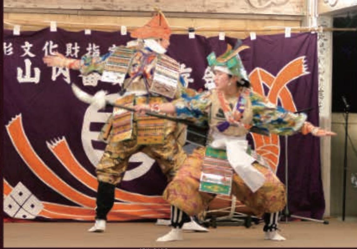
▲48回目の競演会で初めて披露された「熊谷敦盛」。番楽教室の中学1年生が熱演