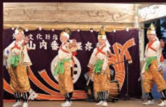
▲ほんぼりを手に観客や舞台をはらい清める「露払」