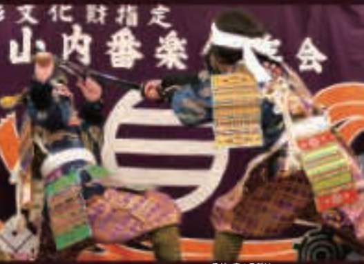
▲刀を振り、激しく舞う「曾我兄弟」