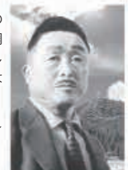
秋田追分創始者 鳥井森鈴翁