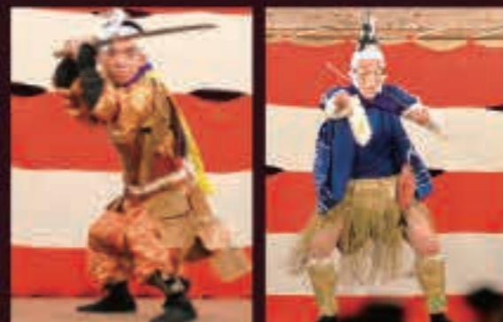
▲三種町向達子番楽の「新舞」◎と「夷」◎