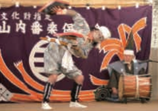
▲五穀豊穡を祈る「山の神」