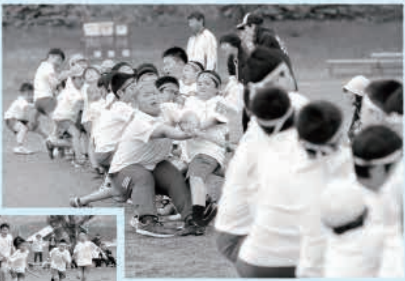
みんなの力を合わせて、つなぎきも、リレーも優勝だ!

五城目小学校の大運動会は5月13日、同小のグラウンドで行われました。 今年の運動会のテーマは「赤青黄三つの光 重なり合って 白く輝け」。 児童らは徒競走や色別対抗リレー、学年種目などで熱戦を繰り広げました。勝利を目指して頑張る児童の姿に観客席からは盛んな声援が送られました。