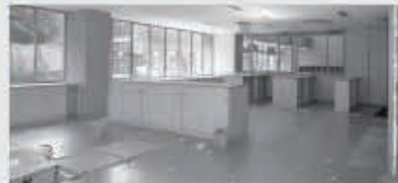
職員室は、外部と昇降口を見渡すことのできる明るい作りになっています。