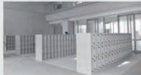
昇降口の様子。吹き抜けの空間で、開放的な仕上がりとなっています。