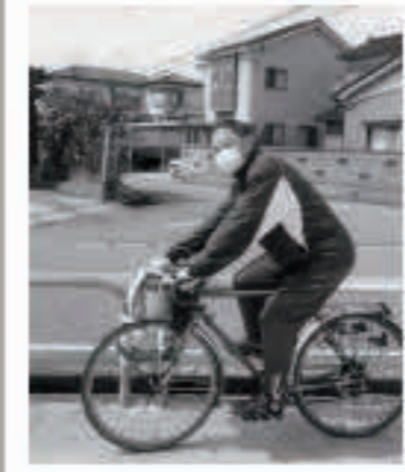
五城目町までを目標に体足を鍛えています。

小学生になってからは、夏休みに毎年のように墓参りに赴いていました。就職後は、墓参りの機会も少なくなりましたが、五城目町に関心を持ち続けており、遠く離れた今の居住地でも秋田県内所在の民放ラジオ局放送を聴くことができるため、休日にはニュース番組を聴取して、五城目町や秋田県のできごとを把握し続けています。