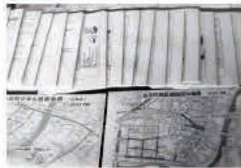
古川町町内会では、「町自主防災組織等活動支援助成金」を活用し、避難経路図などを掲載した防災マップを作成・配布しました。

町内会や自主防災組織での訓練・活動に必要な消耗品の購入や、防災マップ・パンフレット等の作成などに「町自主防災組織等活動支援助成金」を活用することができます。助成限度額は2万円です。 昨年度は3団体が活用し、地域の防災情報をまとめた「防災ファイル」を作成して町内会の全戸へ配付するなどの取り組みがありました。 活用を検討する場合は、町住民生活課までご相談ください。