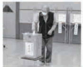
町内14か所で投票が行われ、午後8時から役場正庁で開票作業を行いました。