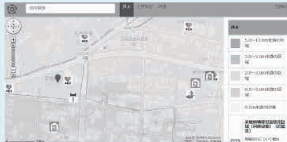
WEB版ハザードマップの画面例。洪水・土砂災害・津波の災害別に3種類があり、住所を入力すると、その地点の情報を確認することができます。

WEB版のハザードマップはスマートフォンやパソコンから閲覧することが可能です。もしもの時に備え、災害の種類ごとに、自宅周辺の危険な場所などを確認しておきましょう。