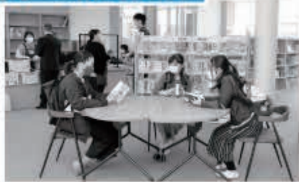
地域図書室「わーくる」には、町内外から多様な世代の方々々が来室しました。