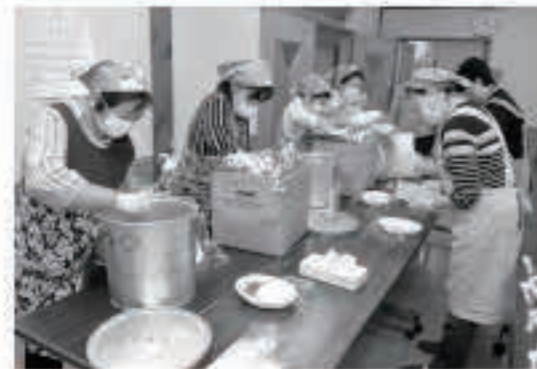
令和元年5月26日に実施の町総合防災訓練では、炊き出しや避難所の開設運営などを行い、緊急時の行動を確認しました。