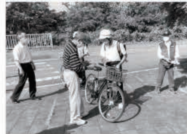
町防犯協会の皆さんや五城目警察署の署員らが活動に参加し、「2ロック」を呼びかけました。

自転車に2つのかぎをかける「2ロック」をすることで窃盗犯のやる気をそぐ見た目の効果も生まれ、盗まれにくくなります。盗難被害にあわないよう、自転車には2つ以上のかぎをかけましょう。