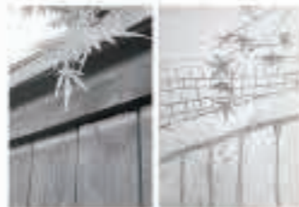
町で撮った写真を参考にしながら、絵を描いてみました!

朝市に行きたいと思っていて足を運んでみましたが、日を間違えたので、代わりにお気に入りのパン屋さんに行きました。また来月お会いしましょう。