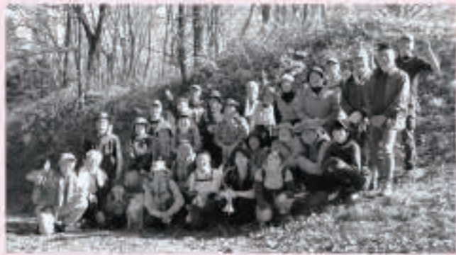
約40人が参加し、森山の第2高地付近にヤマユリの球根25個を植栽しました。