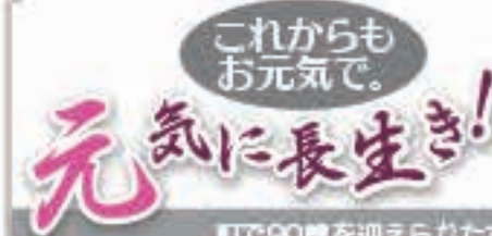
町で90歳を迎えられた方をご紹介します