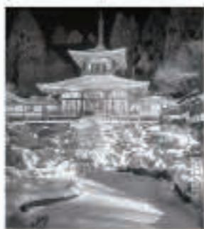
友人たちと男鹿市の大龍寺で新年を迎えました。