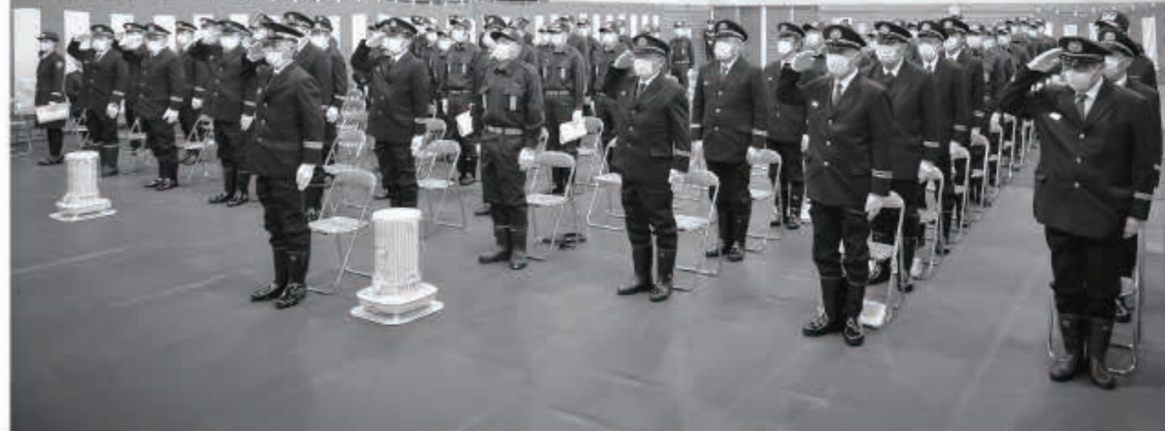
消防出初め式には町消防団員ら105人が出席し、気持ちを新たに防災活動へ取り組むことを誓い合いました。