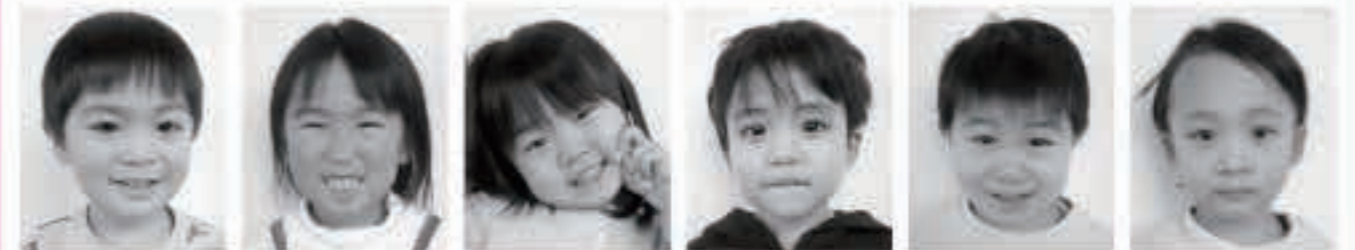
□□ □□くん (樋口) □□ □□ちゃん (帝釈寺) □□ □□ちゃん (広ケ野) □□ □□くん (雀 館) □□□□くん (新畑町) □□ □□くん (東磯ノ目)

この時期に乳歯の歯列はほぼ完成するので、家族みんなで協力しあい、正しい歯の健康維持について基本を身につけましょう。