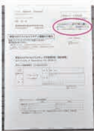
3回目接種済証の右上に接種日を記載しています。