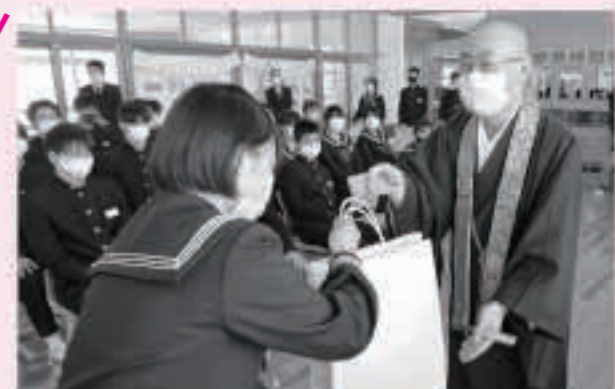
合格を祈願し、地域の方々や企業が応援の品を生徒へ手渡しました。

3年生は、皆さんからの激励に応え、全員が一丸となって受験に挑むことを誓いました。