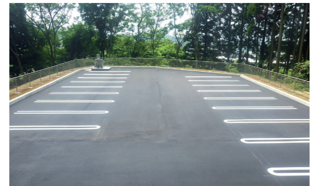
火葬場向かいの町有地を整備し、新たに駐車場敷地を整備。17台分のスペースを設け、合わせて40台が駐車可能です。