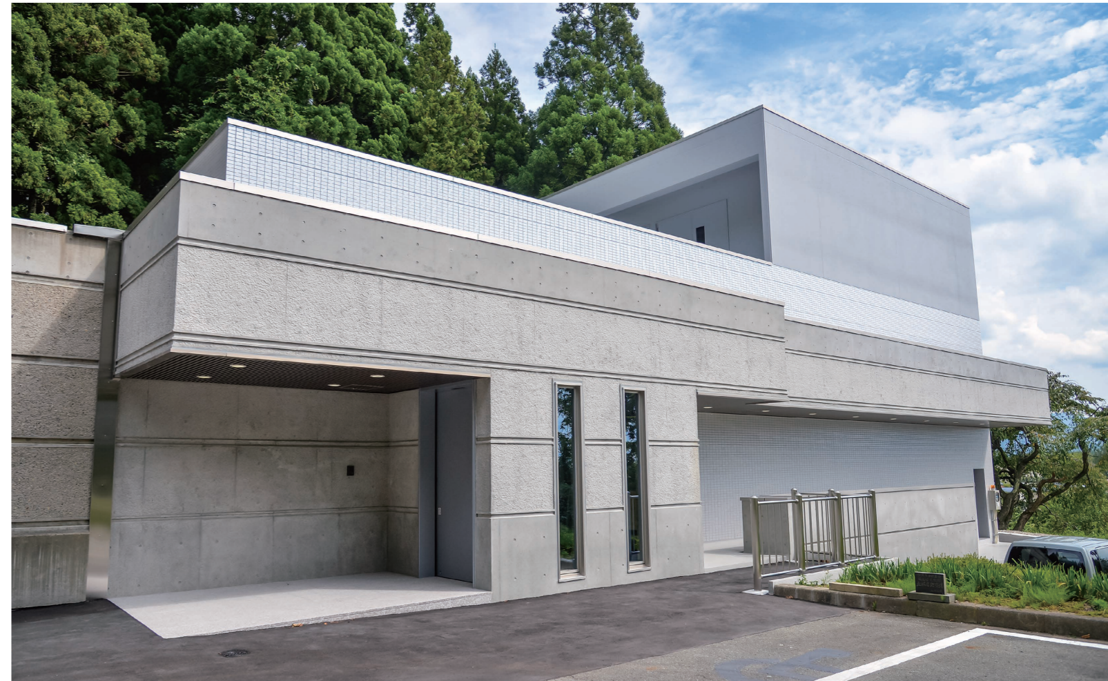
今後見込まれる火葬需要の増加に対応するため、既存建物の隣に新たな棟を増築。昨年8月から供用を開始しています。