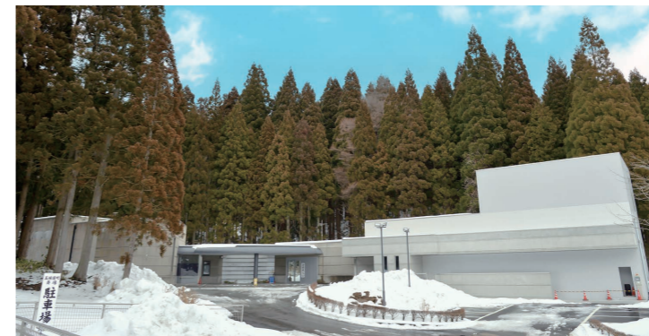
本年2月から全面的な供用を開始した町火葬場。左側が改修を行った既存建物で、右側が新たに増築した建物です。