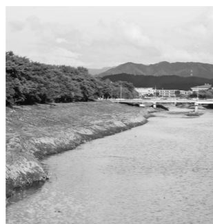
馬場目川の洲ざらい工事の様子

小学生3名、中学生1名が体験しております。 現在、青森県から小学生1名が留学中であり、さらに9月中旬には愛知県より小学生1名が留学する予定であります。 今後は、教育留学を体験された児童生徒や保護者の皆さまの感想を町ホームページで紹介するなど、積極的な情報発信に努めてまいります。